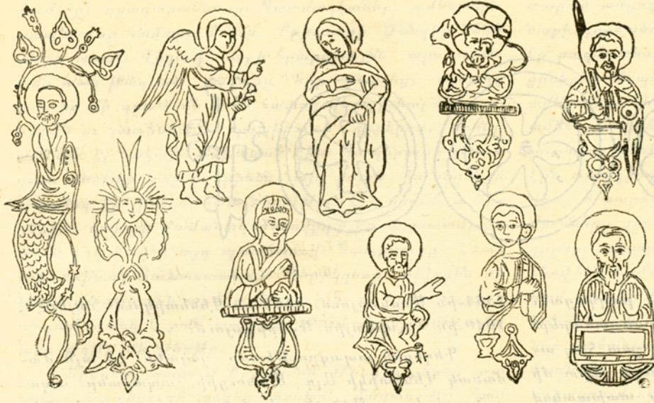
Շարական XVII դարի Ս. Էջիածնայ մատենադարանում

Ամենից ծանր ու պատվարը պարտականությունն ընկնում է հարկավ Էջիածնում հիմնված, Վեհ Կաթողիկոսի հովանավորութեան տակ գործող Կենդրոնական Յանձնաժողովի վրայ, որի ծրագրած պայմաններում տեղի է ունենալու տօնակատարությունը: Նրա խելացի և եռանդուն գործունեությունից է կախված տօնի յաջողությունը: Նա շատ գործ ունի կատարելու՝ որպէս զի այս հազվագէտ, պանծալի, համազգային յօրելիանները արժանավայել կերպով տօնվեն և իրանց ցանկալի բարոյական և կուլտուրական հետքը թողնեն մեր կեանքում: