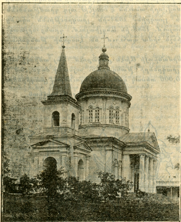
Ն. Նախիջեան. Ս. Խաչ վանքը Նշանատուր 1860 թ. իր տպարանում: