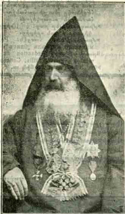
ԳԷՈՐԳ Դ. Կաթողիկոս ամենայն Հայոց

Անցեալ 1912 թ. հոկտ. 13-ից արդէն բացուել է Ամենայն Հայոց Վեհափառ Հայրապետի կարգադրութեամբ: ամեն տեղ, հայութեան բոլոր շրջաններում, 1500-ամեայ տառերի դիւտի և 400-ամեայ հայ տպագրութեան համազգային բաղաբաղկութեան մեծ տօնը—յօրեկանը, եկեղեցական և դպրոցական հանդէսներով: