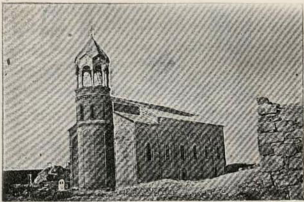
Ս. Մեսրոպի եկեղեցին (Օճական)

իրենց ամբողջ կորովը, ամբողջ ոյժը, ամբողջ կեանքը նուիրած են այդ խաչալին: