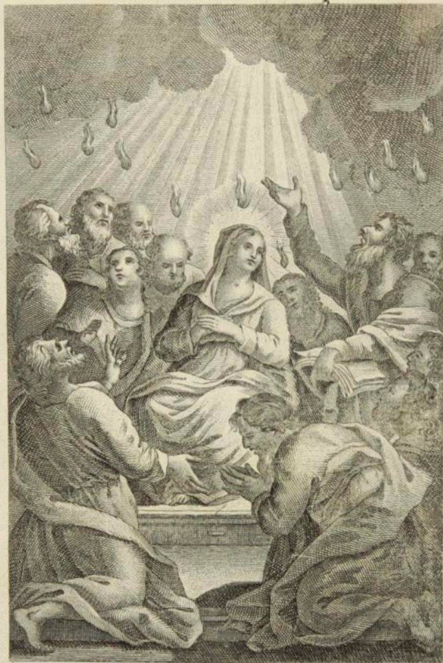
Գալուստ Հոգւոյն Արբոյ: