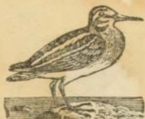
Ղայ , Մուռնի :