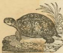
Կրեայ , Թասապտը :