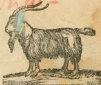
Յուլ, Պաշտպան :