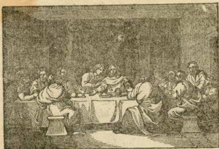
Համար . 8 :