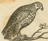
Յին , Զայլա :