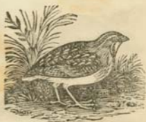
Կաքաւ , Բեռնի :