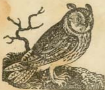
Բուռ , Պայգիւն :