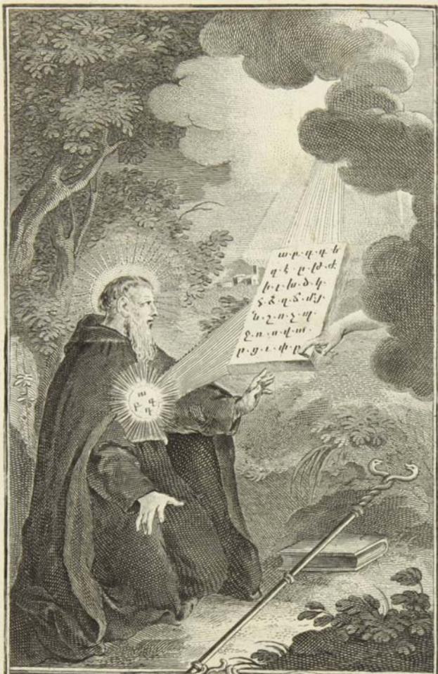
Կերպարան տառից՝ սղբեալ յանեղէն . Ա՛նբարո՛ւբայ մեծի՛ ձեռ սմբ յու սե զէ՛ն :