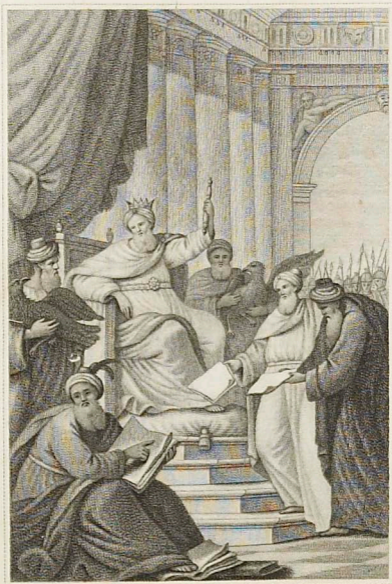
Վաղարշակ պարթևի հայոց թագաւոր :