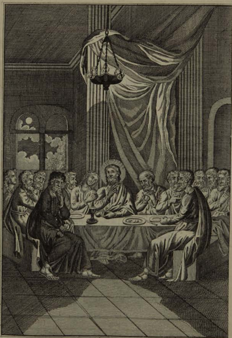
Չայս արամբիր առ իմոյ յիշատակի.