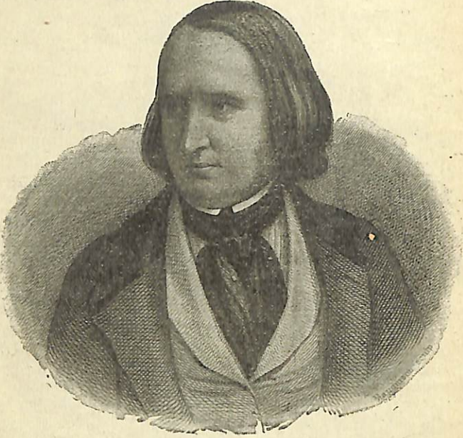
ԱԼՖՐԵՏ ՏՐ ՎԻՆԵՆ