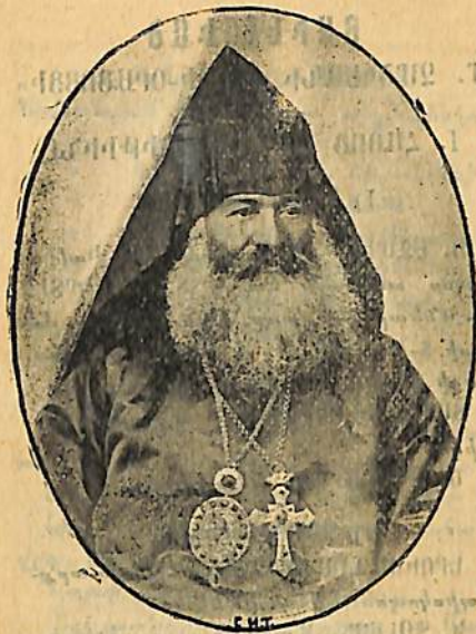
ՎՐԱՍՏԱՆԻ ԵՒ ԻՄԵՐԵՅԻ ԹԷՄԻ ԱՌԱՋՆՈՐԴ ԳԱՐԵԳԻՆ ԵՊԻՍԿՈՊՈՍ ՍԱԹՈՒՆԵԱՆ

Սթէ երբեմն եղանակի գուշակութիւնները ճիշտ չեն կատարվում, այդ պատահում է երկրի աշխարհագրական դիրքից և օդերևութաբանական դանադան պատճառներից, նամանաւանդ, պարբերաբար բոլոր ուղղութեամբ փշոզ հողմերի, ցիկլոնների և մթնոլորտի լեղաշրջման (пертурбация) փամանակ. Ծ. Աշխ.