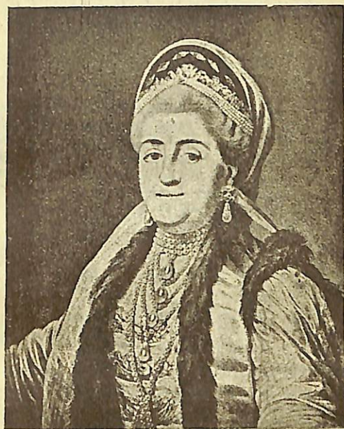
ԿԱՅՍՐՈՒՂԻ ԵԿԱՏԵՐԻՆԱ II

Այս էր նոր առաջնորդի ամբողջ հոտը: Բայց Յովսէփի ժամանակ և Յովսէփի անխոնջ ջանքերով Առևտարանի հայոց թիւը շատ մեծացաւ նորանոր գաղթականութիւններ միջոցով: