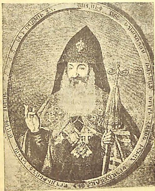
ՅՈՎԱՆԷՓ ԱՐԲԵՊԻՍԿՈՍՍ ԱՐՂՈՒԹԵԱՆ