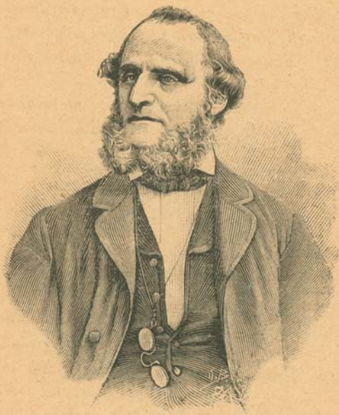
ՔՐՕՏ. ՏՕՔՔ. ՇԷՌՄԱՆ ԳԼԷՆՔԷ †