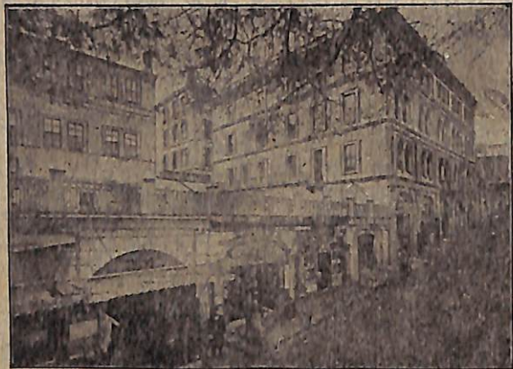
THE BIBLE HOUSE, CONSTANTINOPLE