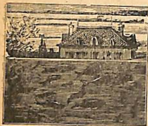
ՅՈՎԱՆԻԱԿՈՒԹԵՒՆ . — Գետոյն

խորը ծածան մայրիկ կը յանձնարարէր պղտիկ ծածաններուն, որպէս զի եզերքին մօտ չերթան՝ ձկնորսին որս չերթալու համար : Բայց ողորումներու եղանակն էր, ծածանները միայն երկինք և շուր կը տեսնէին, և կը կարծէին թէ այլ եւս ձրկնորսներ չկան . կը ծաղրեն իրենց մօր խրատները և հեռուն կ'երթան : Սակայն ծածան մայրիկ իրաւունք ունէր, ջուրը կ'իջնէ և ձկներն ցամաքը կը մնան, ուր կը բռնուին և կերակուր կ'ըլան :