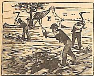
տղայքն հասկըցան թէ քնշու համար իրենց հայրը խօսած էր «Գանձին» նկատմամբ: