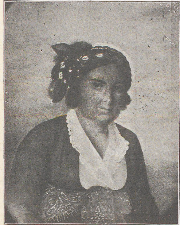
241—ՏԻԻԻՆ ԳՐԻԳՈՐ ԶԵԼԷՊԻ ՏԻԻԶ

կանց՝ թագաւորին շատ սիրելի ըլլալն էր : Անոնք միշտ ազատ ելեւմուտք ունէին պալա- տան մէջ և քանի մը տուրքերէ բոլորովին ազատ էին :