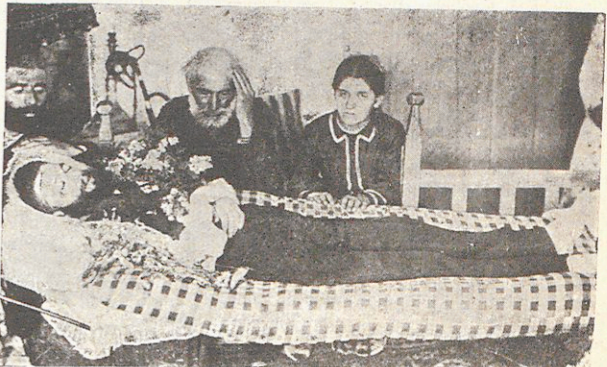
240—ՊԵՇԿԵՕԹԻՒՐԵԱՆ ԳԱՅԱՂԻՆ ՄԷՋ

Իր ճշմարտապէս բանաստեղծական կեանքը որ ծնողքին գերեզմանին քով կ'աճէր և երգէտին կ'երկրպագէր, իրեն շատ ներշնչումներ կուտար գրելու, արտադրելու: Կը յառէր շարունակ այն բանաստեղծական տեսարանին որ Խարբերդի առջև կը պարզուի, կը սեւեւէր այն բանաստեղծական կապոյտին որ քաղքին վերելը կը տարածուի, և իր մեղամաղձիկ հողին կը յուզուէր ու կ'արատասուէր այն գերեզմանին վրայ ուր իր ծնողքը թաղուած էին: 1889ի վերջերը թոքախտով կը բռնուի հէք երիտասարդը, — ծնողքին իրեն թողած միակ ժառանգութիւնը: Կը սեանէի որ կը հիւծէր հեազնեաէ, արիւն կը թքնէր: Օր մը՝ «ա՛լ բարեկամներս կը խորշին իւմէ», բտաւ ստակալի մեղմութեամբ մը: Քանի մը որ վերջը չը կրցաւ զայ դպրոց՝ որ չորս տարիէ ի վեր կը դասախօսէր: