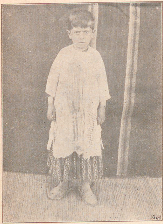
ՔԷՍԱՊՅԻ ՈՐԲ ՏՂԱՅ ՄԸ

Հեզ ու քուտան , այլ մտացի Փոքրիկ տղայ մ'եմ ֆեսապցի , Միսֆու է քափուր , փորքս նօքի , Ուսում միայն ինձ շամբուի :