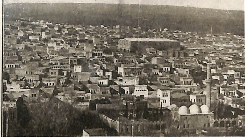
THE WHITE WALLS OF URFÂ. THE LARGE BUILDING TO RIGHT OF CENTRE IS THE GREGORIAN CHURCH, THE FOUNDATION OF WHICH IS SUPPOSED TO HAVE BEEN LAID BY THADDEUS, ONE OF THE SEVENTY DISCIPLES. IT WAS IN THIS CHURCH THAT 2,500 ARMENIANS WERE MASSACRED, A SCENE WITNESSED BY MISS SHATTUCK.

Verlag Orientalischer Schriften P. JOH. AWETARANIAN SCHUMLA (Bulgarien) 1904