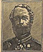
85 Տր. Ծննդ. Քրիստիան Թ. Թագ. Տանիմարգալի.

8 26 ԳԵ. զԿ. ԼԸ. օր մեծ պնց: 10 105 Յն. Տօն ախնայն երկնային չօրաց: Տճ. Աւարեի Իննիտ: