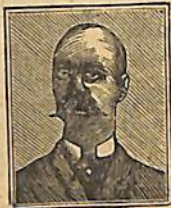
58 Տար. Ծննդ. Եօրկիոս Ա. Թագ. Յուհաստանի :

Մձրնայ հայրապետին , Մարուգէի ճգնաւորին և Մեկտոսի եպիսկոպոսին : Լ. Սղէ-իւն էպիսկոպոսի :