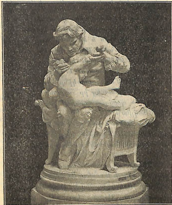
Զեններ ծաղիկ է պատուաստւում Վի երեխայի: Մարմարիով, արձան, կանդնեյրսոմ Եւլօնիում, գործ Մոնտիկերդէ: