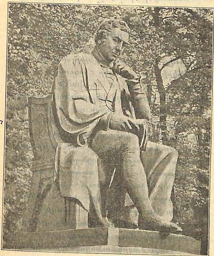
Չեչների profile արձանն է, որ կանգնած է Լոնդոնում, Կենսաբանական ինստիտուտի սրահում (պարտքով):