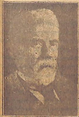
Ռուբէն Քաչազնունի Հայաստանի Հանրապետութեան անդրադիւրսի վարչապետ

Այդպիսի միապետութեան մէ թագաւորի ինքնակալական իշխա նութիւնը սահմանափակւած է ժո ղովրդին վերապահած իրաւունք