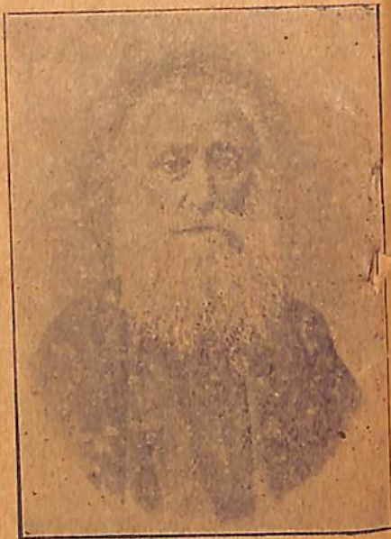
Ա. Ղ ի ռ ա ն

նեց կրօնաւորի սքեմ և կոչւեցաւ Ղևոնդ—1840 թ. ձեռնադրուեց քա- հանայ: 1843 թ. հիմնեց «Բազմա- վէպ» թերթը Գար. վարդ. Այվա- զովսկու նախաձեռնութեամբ, որի զլխաւոր աշխատակիցն եղաւ Հ. Ղևոնդ Ալիշանը—Նահապետ անու- նով: 1848 թ. յեղափոխութեան ժա- մանակ նա դարձաւ վանք և «Բազ- մավէպ»-ի խմբագրութիւնն իր ձեռքն առաւ (1849—1852 թ.):