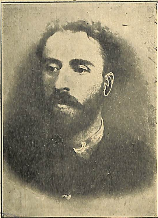
† ԷԳՆԱՏԷ ՆԻՆՕՇՎԻԼԻ

Էգնատէ Իգնորողվան հասարակ գիւղացու որդի էր: Նա ծնունդ է 1861 թ. Չիվէթ գիւղում (Օգուրգէթի գաւառ): Վեց ամսական հասակում զրկուած է ձօրից եւ այնուհետեւ նրան դաստիարակում է հօրաքոյրը, որ հարազատ ձօր նման խնամում է Էգնատէին եւ սովորեցնում նրան վրացերէն այբուրենը: Ապա Էգնատէին յանձնում են մի քահանայի, որ ազնուական ծագում ունէր: Սրանից Էգնատէն համարեա թէ ոչինչ չի սովորում, որովհետեւ ինքը քահանան ոչինչ չէր իմանում: Կէս տարուց յետոյ ազգականները նրան տարան Փոթի, յիշեալ քահանայի եղբոր որդու մօտ, որ պարապում էր փայտի առետուրով: Փոթիում այդ վաճառականի մօտ Էգնատէն ավրոզ իննը ամիս անցրեց ճաթ թիւնլով եւ խոհանոցում աշխատելով: 1871 թուին, Էգնատէի հօրեղբայրը կրկին տանում է նրան Իրանց գիւղը, ուր նա երբեմն ուսումնարան է գտնում, բայց անլի յաճախ իրանց ձիւրն ու կովերն է արածացնում: 1876 թուականին հայրը յանձնում է նրան Օգուրգէթի հոգեւոր դպրոցը, ուր Էգնատէն մեծ առաջադիմութիւն է ցոյց տալիս, բայց երկու տարուց յետոյ այդ դպրոցի աշակերտներն ընդհարումն են ունենում ուսուցիչների հետ եւ Էգնատէին էլ արձակում են դպրոցից: