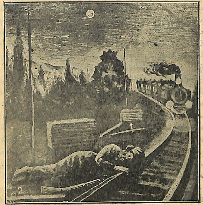
Նկար Տ. Մոսկովիձէի

հապանութիւն անելու գնահ, ամենի առաջ խոնարհուիր, ամենին ծառայիր: Ձէ, շատ փուշ է թշուառ գիւղացու կեանքը... Հիմա էլ մեծ մարդ է գալիս... Երևի շատ մեծ մարդիկ կան աշխարհիս վրայ որ այսքան ծառայութիւններ է հարկաւորուում... Մեծ մարդիկ... Գզրի խօսքին՝ թէ ո՞վ է անցնողը, ասել են. «Ի՛նչ քո գործն է». էլի որ ինչ մեր գործն է: Մեր գործն այն է, որ երբ հրամայում են պիտի կատարենք, ապա թէ ոչ Սիբիր կը քշեն... Երանի իմանամ ի՛նչպիսի տեղ է այդ Սիբիրը: Պիտի որ շատ վատ տեղ լինի... Արդեօք մեծ մարդկանց չեն ուղարկում Սիբիր: Հ՛րժ, ինչքան միամիտ եմ ես: Մեծ մարդիկ ուրիշներին են ուղարկում, մի՞թէ իրանք իրանց կ'ուղարկեն: Ո՛րքան անտանելի է դժբաղդ գիւղացու կեանքը: Վճարիր, ծառայիր, խոնարհուիր. իսկ եթէ որ մի բանում սխալուեցիր, Սիբիր կը քշեն... Արդեօք ինչ պիտի անէին մեծ մարդիկ, եթէ գիւղացիք չլինէին աշխարհիս երեսին: Դիցուք ես, գիւղացիս, Սիբիրից չվախենայի ու չգայի պահապանութիւն անելու... Հ՛րժ, ինչեր չի մտածի մարդս: Մի անգամ ասին գնահ ու անմիջապէս եկայ... Աստուած, ինչ տարօրինակ մտքեր են անցնում գլխովս այս գիշեր: Աստեղ, Կացիան կանգ առաւ, նայեց երկնքին ու շարունակեց՝ «բաւական ժամանակ է անցել,