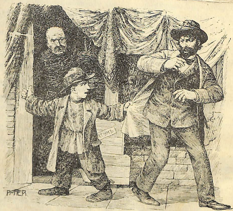
Էստի համեցէր, էստի համեցէր...

—Էստի համեցէ, էստի հա- մեցէր... — կանչում էր Գիբորը: