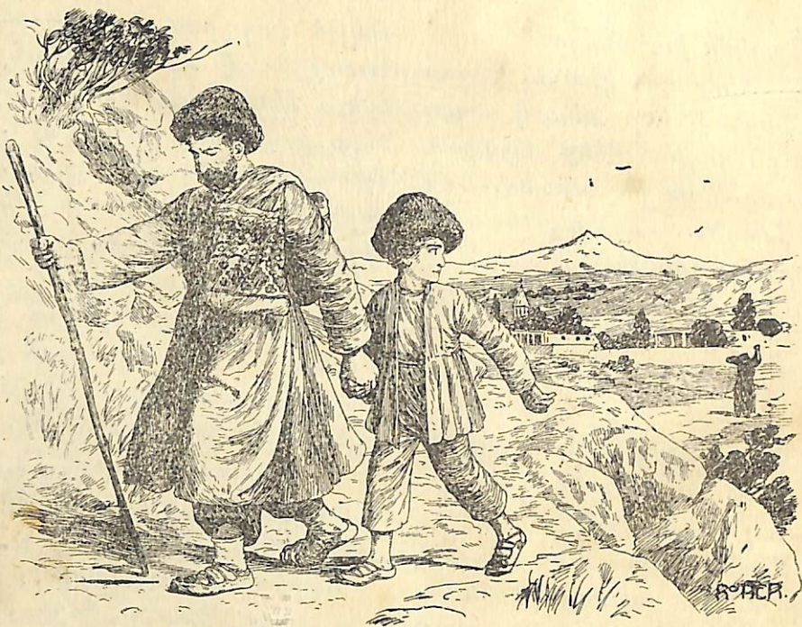
Գիւորը շուտ շուտ էր նայում...

Նոր սարիցն եկած, վայրենի, իսկ մարդն ուրախ էր, որ մի բանի տարով անվարձ ծառայ էր գտել: