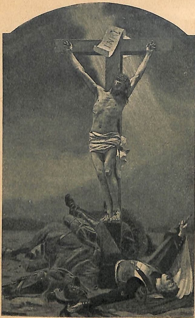
Յանուս Մարգկութեան և Հայրենիքի.