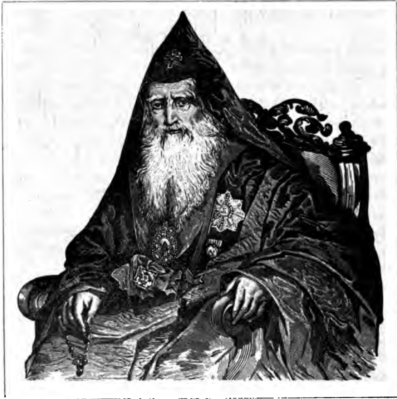
ՆԵՐՍԷՍ Ե. ԱՆՏԱՐԱԿԵՑԻ