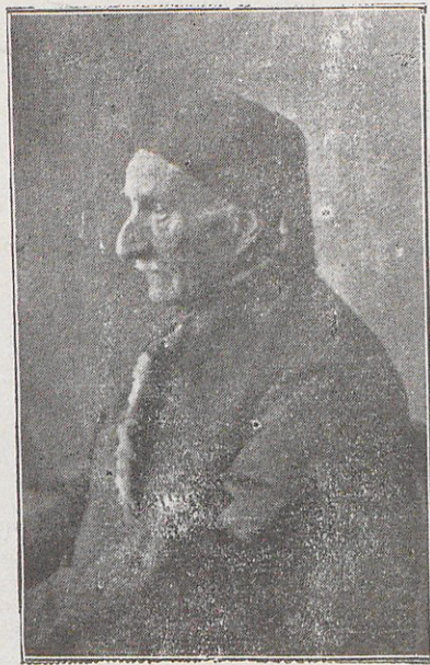
258.— ԱՐՐԱՀԱՍՄ ԱՊՏՈՒԼԼԱՆ

Ապտուլլան գերդաստանին կը հանդիպինք նաեւ Վենետիկի մէջ որոնք սակայն այժմ գո- ւովիւն չունին :