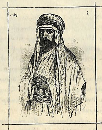
Ա Ր Ա Բ

Բոլոր արաբները բաժանուած էին բազմաթիւ մանր ցեղերի, որոնցից իւրաքանչիւրն իր առանձին