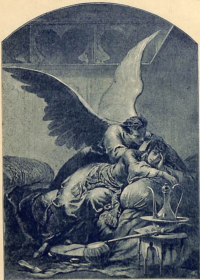
Եւ ահաւասիկ կարծես լսում է Մի ձայն դիւբական, որ մրմնջում է.— Մի լար զաւակս, 'ի զուր դու մի լար: