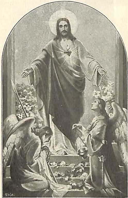
Ո՛վ քաղցրագու՞ծ Սիրտ իմոյ Յիսուսի, Տուր կնձ միշտ սիրել ըզՔեզ արելի: