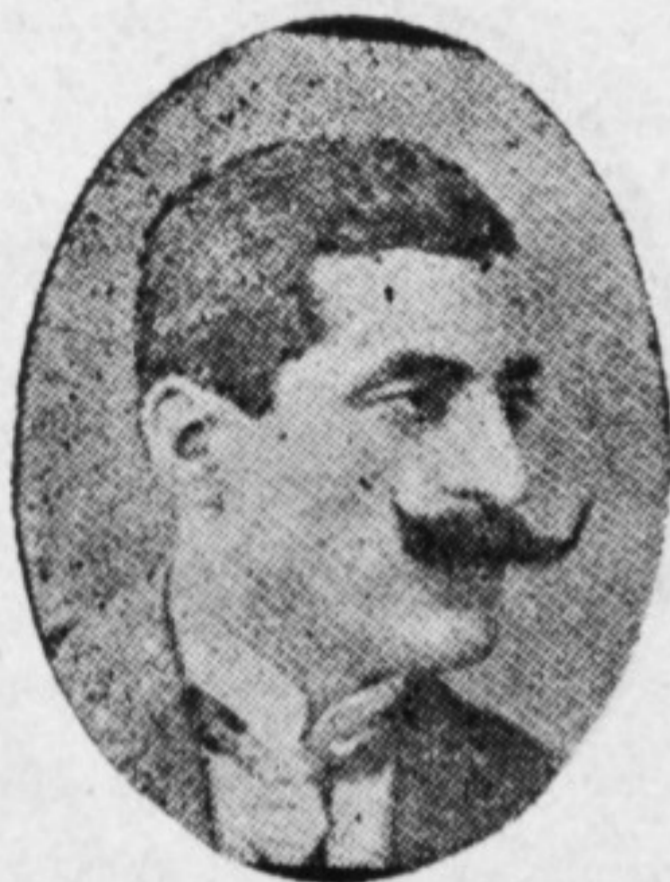
Վ Ա Ր Դ Դ Է Ս

Առաջնորդ Եդեսիոյ, ծնած 1876ին, Պրուսայի Եէնիճէ գիւղը: Գործերը «Միութենական հարցն և Շնորհալի», և Սարսուռներ: