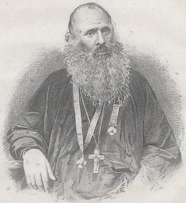
Պատրիարքա Գրիգորի Գրիգորի ՍՄԱԴ ՔԱՂԱՍՏԱՅ ԵՒ ԱՍՊԵՏ Pov. d. Johanness Catchesick