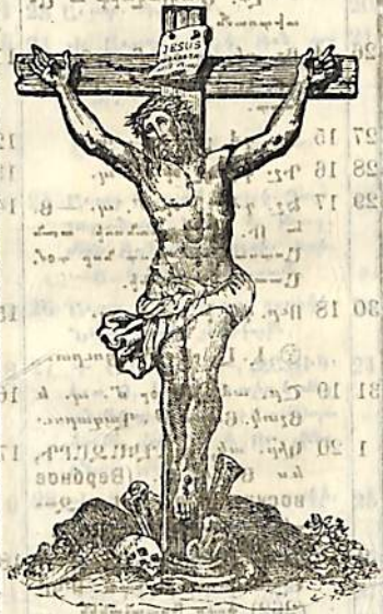
Խաչելու թիւն Յիսուսի. ի Մարտի 25.