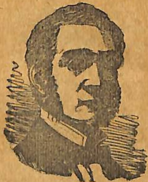
ԱՐՐ ՇԷՆՐԻ ԻԼԵՇԹ

Շատ մը Նիտտերէ ետքը Անգղիոյ արտաքոյ կարգի երեսփոխան Լորտ Սալիզպորիի առաջարկութիւնները ԻկնաթիէՖ զօրապետն