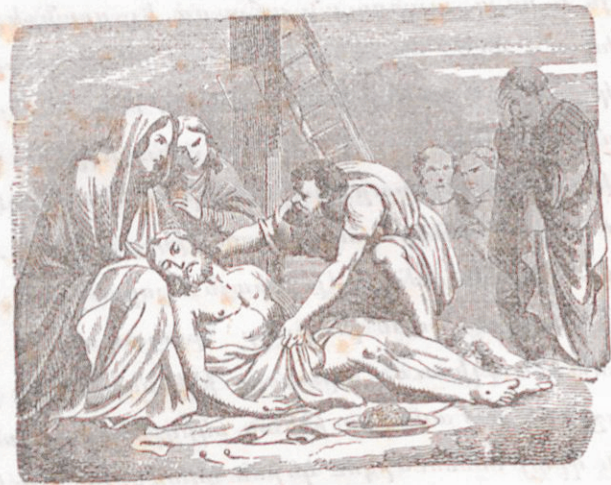
Երկրորդ առաւօտը, որ շաբաթ էր, գնացին Հրէից քահանայապետներն ու փարիսեցիները Պիղատոսին,

Յովսէփայ հետ եկաւ նաեւ նիկոզեմոս, որ նոյնպէս Յիսուսի հետեւող իշխաններէն մէկն էր. հարիւր լիարի չափ զմուռ՝ հալուէ եւ ուրիշ խնկեղէններ բերաւ. նոր ու մաքուր կառններ առին, իջեցուցին խաչէն Յիսուսի մարմինը, եւ անոնցմով պատեցին՝ ինչպէս որ Հրէից սովորութիւնն էր: Յիսուսի խաչուած տեղին մօտ պարտէզ կար, պարտիզին մէջ ալ նոր գերեզման մի՝ քարի մէջ փորուած, այն գերեզմանը գրին Յիսուսի անապական մարմինը, ահագին քար մի ալ գլորեցին՝ փակեցին անով գերեզմանին բերանն ու գնացին: