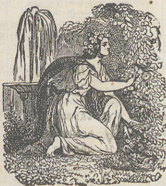
Գարունն է տիպ մանկութեան, Առաւօտ կենաց: