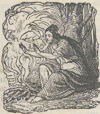
Չմեռն է տիպ ծերութեան, Արեւմուտ կենաց: