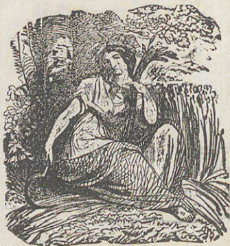
Ամառն է տիպ երիտասարդութեան Միջօրէ կենաց: