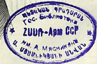
ԳԻՏՆԱԿԱՆ ԱՏԵՓԱՆՆՈՍ ԿԱԶԱՐԵԱՆՑ