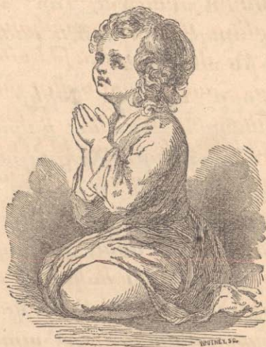
Տէրունական աղօթք :

Ա՛վ Հայր մեր՝ որ երկինքն ես, քու անունդ սուրբ ըլլայ . Բու Թագաւորութիւնդ դայ , քու կամքդ ըլլայ , ինչպէս որ եր- կինքը՝ անանկ ալ երկրիս վրայ . Մեր ամէն աւուր Հացը՝ այսօր մեզի տո՛ւր . Աւ մեզի ներէ՛ մեր