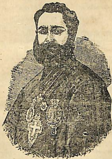
ԻՈՐԵՆ ԱՐՔ ԵՊԻՍԿՈՊՈՍ ՆԱՐ ՊԵՅ

Նախագահ Արբազան Պատրիարք Ատնայտ Ստեփան փաշա Արսլանեան Ատենադպիր Հ. Ալաճաճեան էֆ. Երեսօխոխանք անձինք 140