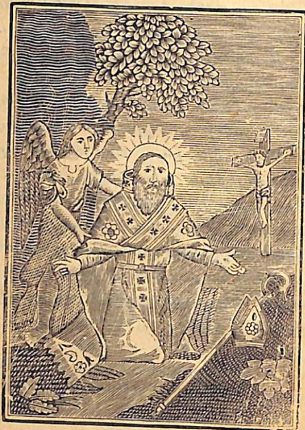
ՍՈՒՐԲ ԳՐԻԳՈՐ ԼՈՒՍՍԱԻՈՐԻՉ