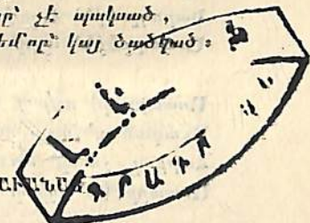
ՄԵՆԱՄԱՐՏ ԵՒ ՅԱՂԹԱՆԱԿ ՋԱՌԱՆԱԿ

Ինձ չէր յայտնի՝ նորա խորհուրդ, թէ ինչն է ուշացնում, Ինքն էր առաջ՝ անկողինքը՝ միատրեւի՝ յօժարում, Ամենայն օր՝ էլ նոյն սէրն է, սրբաէն հուրր՝ չէ սպիտած, Այս տեղ մէկ հատ՝ գաղտնի երկիւղ՝ կարծումեմ որ՝ կայ ծածրած :