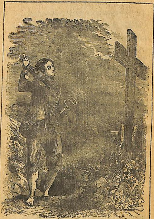
« Ես Աստուծոյ կեցից, և ընդ Քրիստոսի ի խաչ ելից » : ԳԱՅԱՏ. Բ. 19.