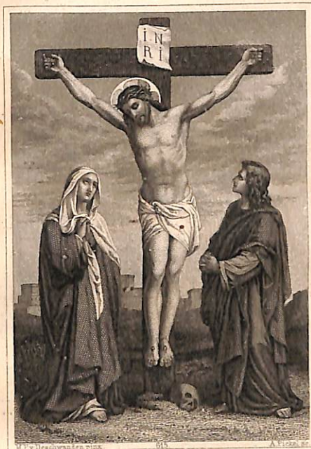
Verlag von Gebr C u N Benziger in Einsiedeln

Տեսակ տեսակ օգուտներէն՝ զոր այս սուրբ մտածութենէն պիտի քաղես, մէկն ալ ԸՄՍԿ, որ դուն չէ թէ միայն անցած մեղքերուդ վրայ ցախ, հասցա նաև վշտանաս, վասն զի քու մէջդ անկարգ կիրքերդ՝ որ զբարեգութ փրկիչդ խաչ հանեցին, ասկաւին կենդանի կը կենան կոր: