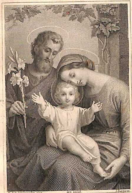
M. P. de Perthevaarden pinx. 1868 del. J. Benninger freres, Editeurs. A. Lansiedeln. New-York & Cincinnati

Թէ որ մեր անձանց վրայ անվտանգութիւնը, Աստուած սպառնութիւնը և կրթութիւնը այս պատերազմին մէջ այնչափ կարևոր են, ինչպէս որ ինչուան հոս աեղ ցուցուեցաւ, սա- կայն ամմէն բանէն աւելի աղօթքը հարկաւոր է (որ է շորթորդ պայման և զէնք գոր վերը գրինք), որով չէ թէ միայն վերը ըսուած բու- ները, հապա ուրիշ ամմէն բարիք մեր Աստուծ- մէն կրնանք ստանալ: Վասն զի աղօթքը գոր- ծիք մին է ստանալու բոլոր այն շնորհները, ու