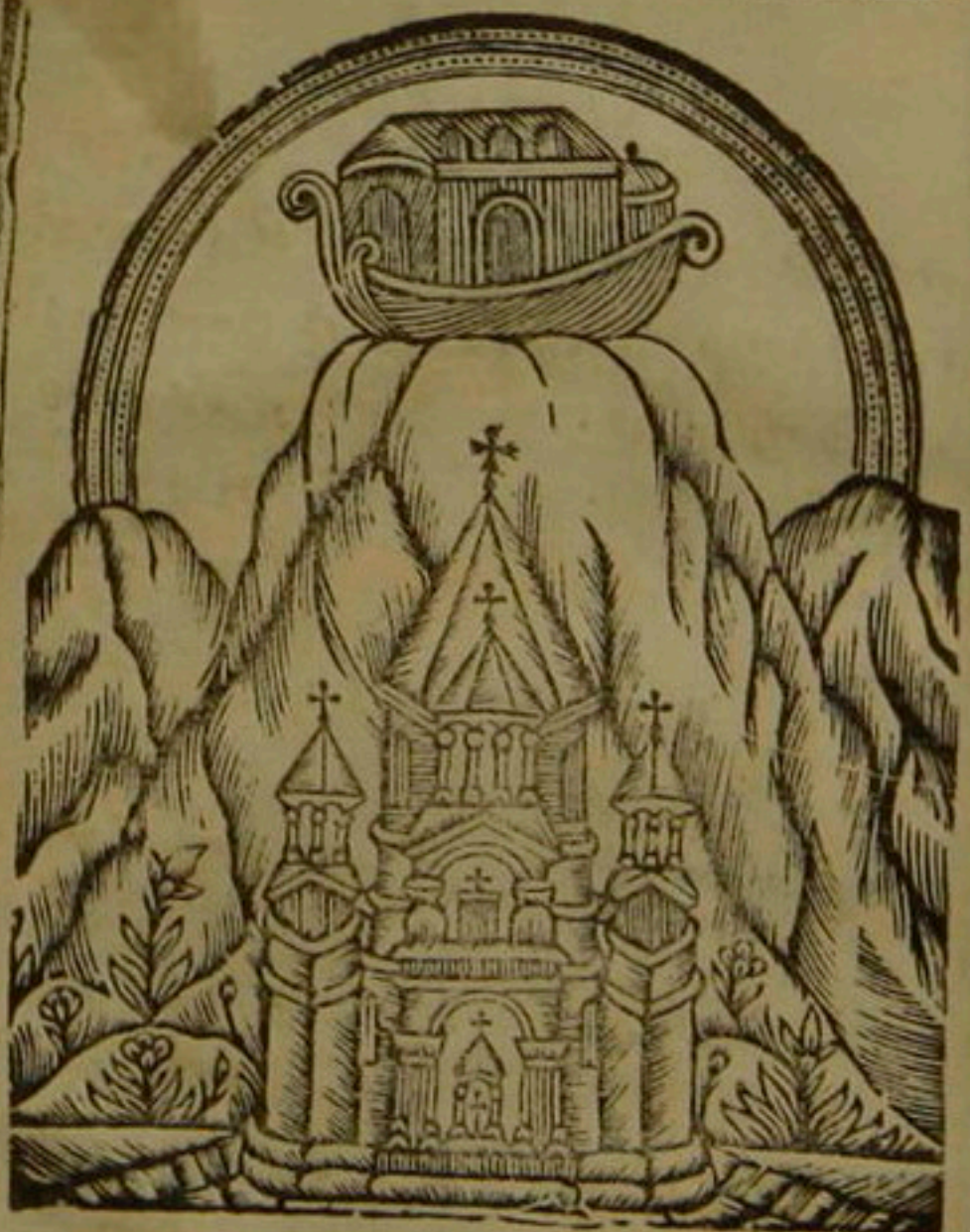
Տապանն՝ Գրգուռն ան գրս Գրգուռն՝ Էրթ ՚ի Մասիս ուր բարձր է Բան զիս .

Ի յորդանանս հերէդս ջրոց ընդ նոխա աշխարհքն Հայոց . պարզեալ զիւր գոգ ամբակուռ շրջե՛ր տապանն մեծամուր .