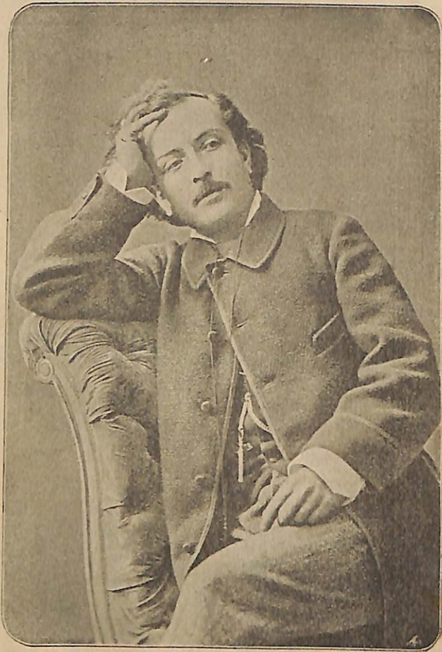
† ՊԵՏՐՈՍ Հ. ԱԴԱՄԵԱՆ