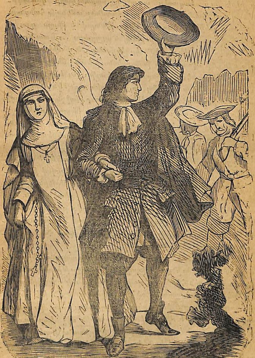
Երբ անոր ձեռքը սեղմեց, ակնարկ մ'ըրաս, որուն վրայ աղեղնաւորներն երեցան.

թիւնն սկսան շարունակել զոր առջի իրիկուընէ ի վեր ընդհատած էին, մարքիզուհին գիշեր ատեն քանի սը յօդուածներ