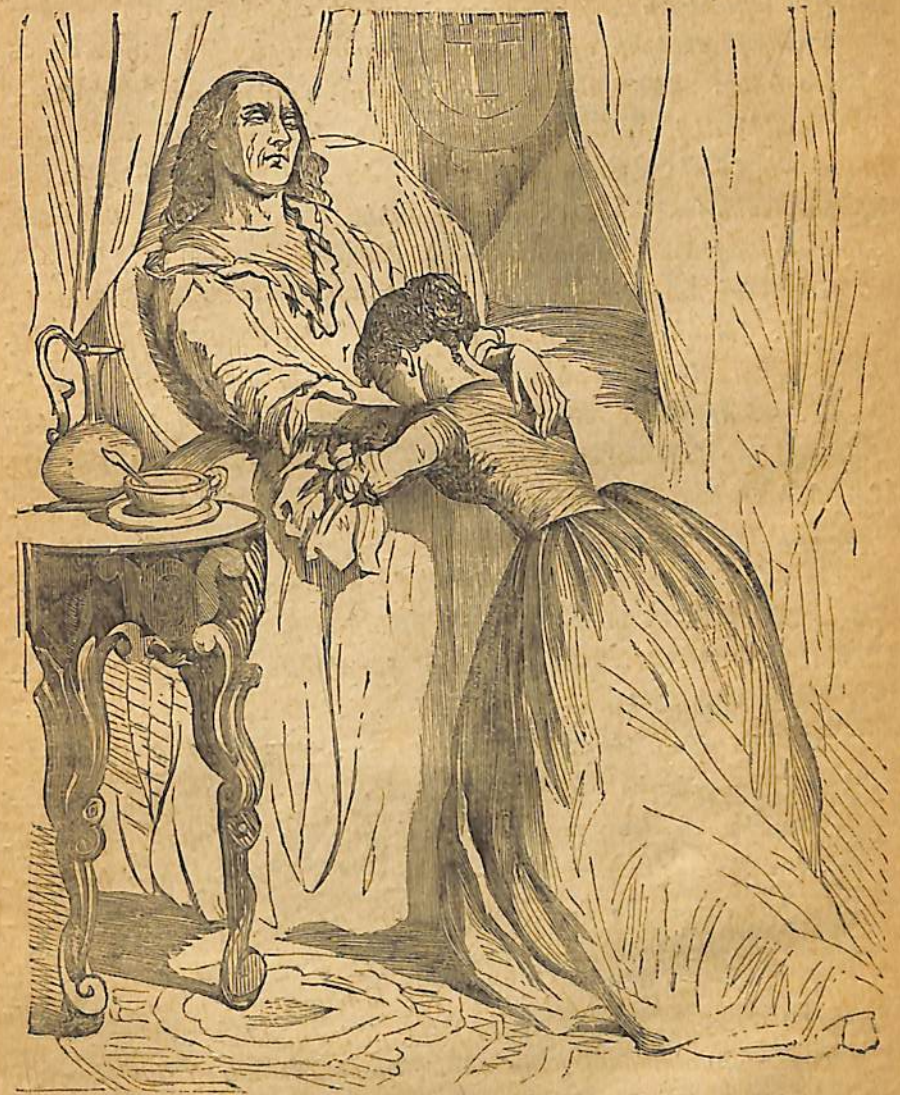
Իւր աղջկան բազուկներուն մէջ նոզին աւանդեց , օրնելով Խ.Ր սպանիչը

նելու դատապարտուեցաւ , կանխաւ սովորական և սրտայ կարգի պանձանիւ- րը կրելով որդէն զի էր դատակնէները յայտն :