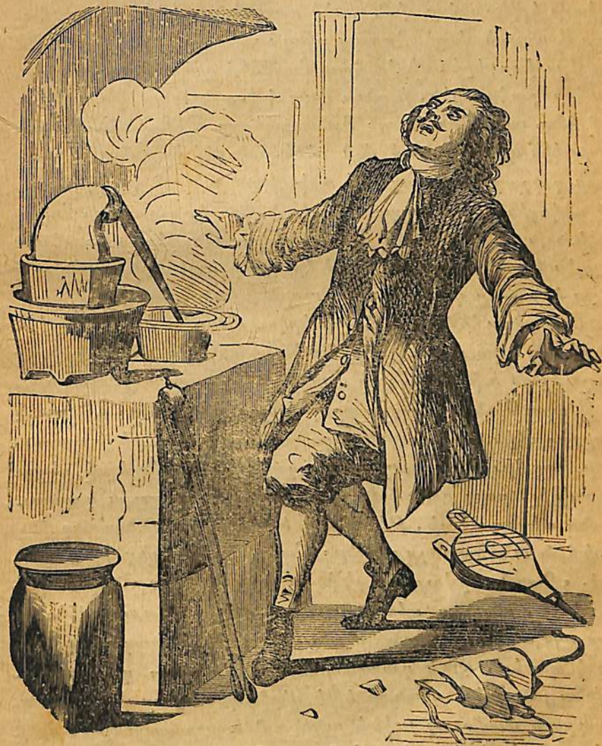
Սենթ-Քրուս կայմակնանար գետին քաւպեցաւ .

— Ի բոլոր սրտէ , տիկին , պատասխանեց քահանան , կարելի եղած հոգևորական պաշտօնները կատարելու կուգամ , միայն կը ցաւիմ որ այսպիսի դժբաղդ պարագայի մը մէջ կը կատարեմ զայն :