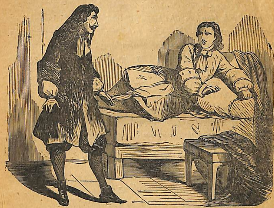
Վտիտ, դալկադեմ, երկայնաներ եւ սեւ բանկոնակ հագած մարդ մը յամբարայլ ներս մտաւ .

1665 տարւոյն վերջերը աշնանային դեղեցիկ իրիկուն մը մեծ բազմութիւնը մը խոնած էր Բօն-Նէօֆի մէկ կողմը որ Տօֆին փողոցը կ'իջնէ :