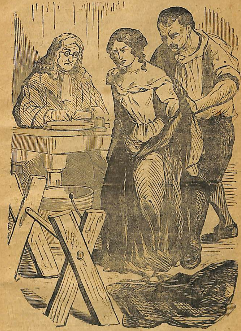
Դահլիճն առանց պատասխանելու սկսաւ կրկնոցը վրայէն հանել .

կա , կաղաչեմ ըսէ ինծի . վասն զի դու խոստացար որ քեզի եկած ամեն փորձութիւնը յայտնես ինծի » :