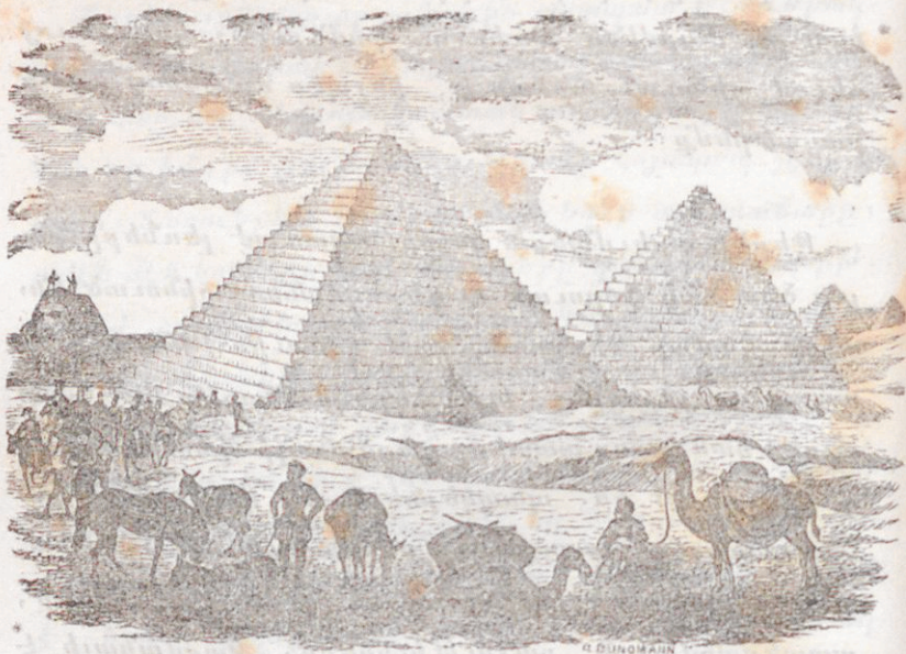
« Ամենէն մեծ բուրգը այնպիսի ապառաժի մը վերայ կեցած է որ գեանին երեսէն 130 ոտնաչափ

Այժմ տեսնեմք թէ ինչ բաներ են Եգիպտոսի հնու թիւններուն մէջ ամենէն հրաշալիները, այսինքն թուրքերը, որ այժմ տաճկերէն Ֆիրաուն քեփեկերի կասուն, իբր թէ Փարաւոնեան լերինք: Ասոնց ճիշդ ստորագրութիւնը խօսքով անելը ամենագիտար բան է. եւրոպացի ճանապարհորդին մէկը այս կերպով կնկարագրէ այն բուրգերուն ամենէն մեծը, որ կասուի նաեւ բուրգն Քէսպսի. ինքը տեսեր է 1887. ին: