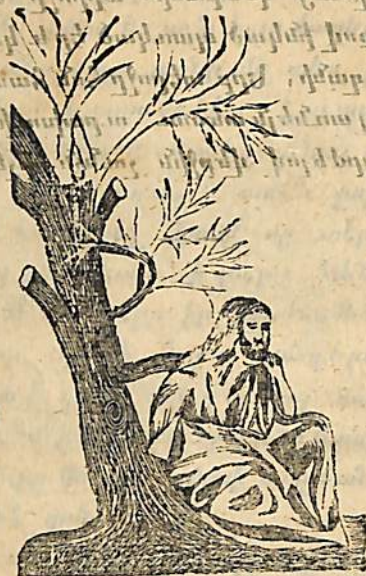
ԵՐԵՄԻ ԹՈՂԵԱՆ ԾՆՈՂՔ

անասն որոպա միմարսնի լուսոյ մեծի՛Ս աչապսն ինչ որոպա ինչ որոպա ինչ որոպա մ մյկմնա ինչ որոպա ինչ որոպա ինչ որոպա րնա մեծ ինչ որոպա ինչ որոպա ինչ որոպա ինչ որոպա ինչ որոպա ինչ որոպա ինչ որոպա