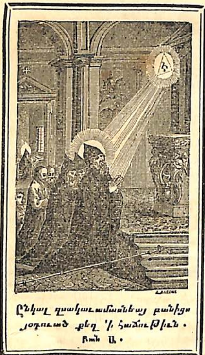
Ընկալ զտակաւամանեայ բանիցս յօղուած քեզ 'ի հաճութիւն . Բան Ա .

Ա. Չ ԱՅՆ հառաջանաց հեծու- թեան սրտի՝ ողբոց աղաղակի քեզ վեր- ընծայեմ, տեսող դազոնեաց, և մա- տուցեալ եղեալ 'ի հար թախծութեան անձին սոչորման՝ զարուզ ըզձից ձն- ձերոյ սասանեալ մտաց, բուրխաւ ա- կամաց սուաբել աւ քեզ, Այլ հոտ- տեսցիս հայեցիս, գթած, քան 'ի պա- տարազն բարբապտուզ մատուցեալ ծը- խոյն բարդութեան, Ընկալ զտակաւ