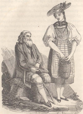
ԳԱՆՈՒՆԷ ԵՒ ՀԱՅՐ ԿՈՐԱ,