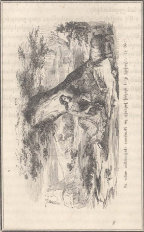
Ein weiser Mann, welcher die Weisheit der Natur in der Natur zu sehen sucht. (S. 106.)