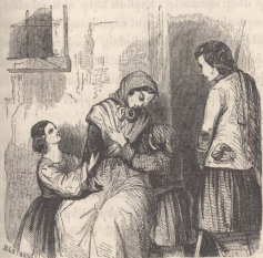
Հնահիք պառաւ կնոջ . էջ 38 .

— Այս խօսքերն աւելի շարժեցին մեզ. Փելիքս որ խօսք տուաւ խրճիբը նորոգելու, մեծ ուրախութեամբ հասանութիւն տուի ըսածին ու ինքն ալ խսկոյն