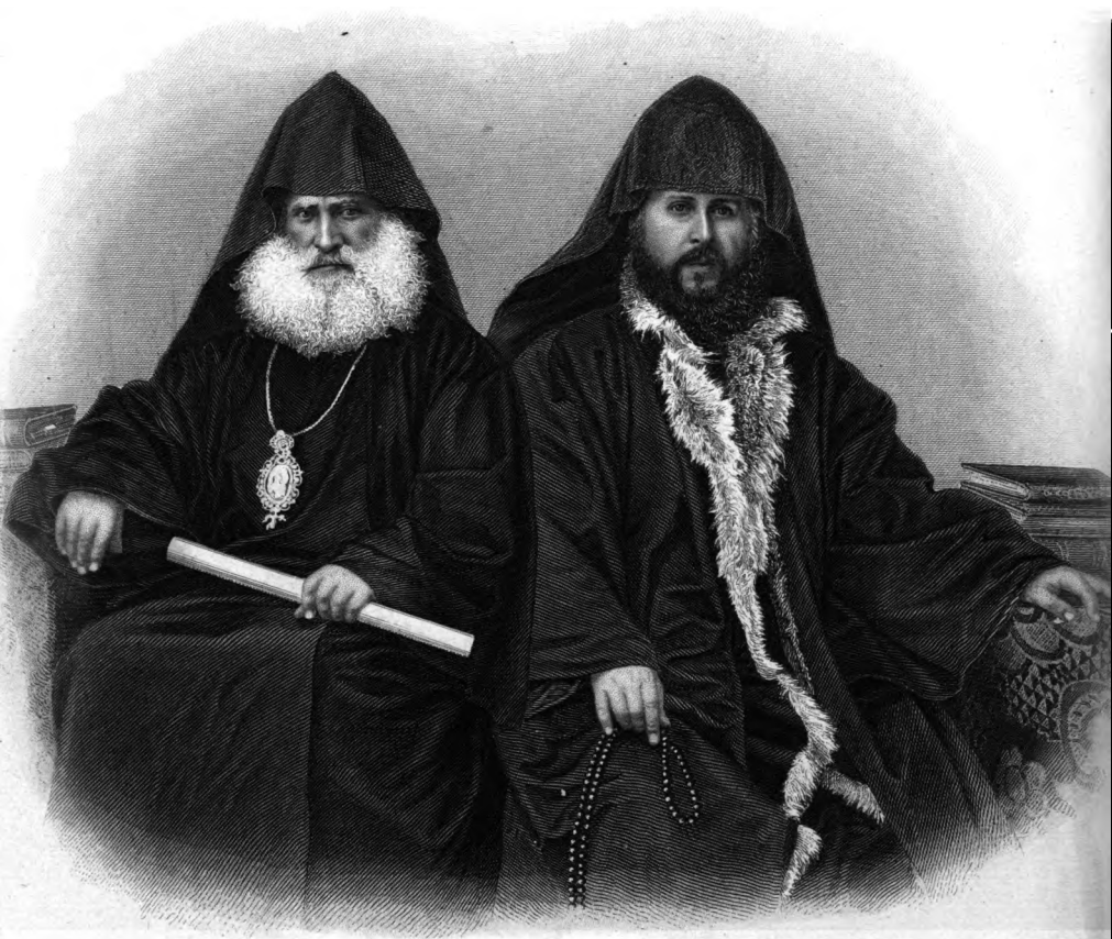
Տեղի և Ժամանակի Կարգով