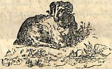
ՔԼԱՎԻ ԱՌ ԲՕՊԵՐԹԻՆ

Քաջ կը տեսնես որ ինձ այսպէս զուարճալի բաներ ըսող այլանդակ մարդը չեմ կրնար ձեզ զոր մեկնի: