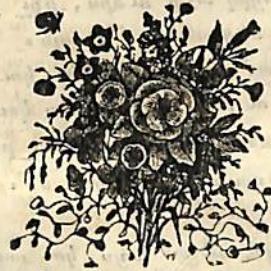
Վ.Ա.Վ.Ի Ա.Ռ. ԲՕՊԵՐԹԻՆԸ

Սիրելի աղջիկս, դրեալ էր թէ զքեզ շատ պիտի խնդացը- նէի և թէ կրկնակի յիմար պիտի գտնուէի: